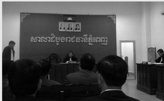
(សវនាការ នៅសាលាដំបូងរាជធានីភ្នំពេញ)

សេចក្តីសម្រេចរបស់តុលាការតម្រូវឲ្យតំណាងរាស្ត្រស្រ្តី មូរ សុខហួរ បង់ប្រាក់ពិន័យ និងប្រាក់សំណងជម្ងឺ ចិត្តឲ្យដើមបណ្តឹងរដ្ឋប្បវេណី [លោកនាយករដ្ឋមន្ត្រី] បានក្លាយជាវិវាទផ្លូវច្បាប់មួយផងដែរលើនីតិវិធីបង្ខំដល់រូបកាយ ប្រសិនបើអ្នកចាញ់ក្តី [លោកជំទាវ មូរ សុខហួរ] មិនទទួលស្គាល់សេចក្តីសម្រេចរបស់តុលាការ។ មាត្រា ៥៣៣ នៃ ក្រមនីតិវិធីព្រហ្មទណ្ឌ ឆ្នាំ២០០៧ បានណែនាំឲ្យដើមបណ្តឹងរដ្ឋប្បវេណី ជូនភស្តុតាងថា ខ្លួនបានប្រើអស់មធ្យោបាយ ក្នុងការរឹបអូសចលនវត្ថុ ឬអចលនវត្ថុដើម្បីទារប្រាក់សំណង និងជម្ងឺចិត្តមុនពេលអនុវត្តការបង្ខំដល់រូបកាយ។