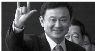
លោក ថាក់ស៊ីន ស៊ុណាវ៉ាត្រា

ផ្ទាល់នាយករដ្ឋមន្ត្រីកម្ពុជា និងជាទីប្រឹក្សារដ្ឋាភិបាលកម្ពុជា ទទួលបន្ទុកសេដ្ឋកិច្ច ដោយយោងតាមសំណើរបស់លោក ថាក់ស៊ីន និងសេចក្តីក្រាបបង្គំទូលស្នើ របស់លោកនាយករដ្ឋមន្ត្រី ហ៊ុន សែន ដោយបញ្ជាក់មូលហេតុថា មានភារកិច្ច ផ្ទាល់ខ្លួនច្រើន មិនអាចបំពេញកិច្ចការជាទីប្រឹក្សាកម្ពុជានេះបាន។