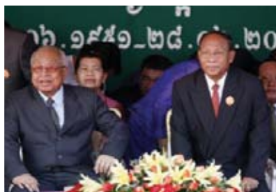
(លោក ជា ស៊ីម និង លោក ហេង សំរិន ក្នុងពិធីរំលឹកខួបទី៥៩ ថ្ងៃបង្កើតគណបក្សប្រជាជនកម្ពុជា ២៨ មិថុនា ២០១០)

»» ២៨ មិថុនា ២០១០ ៖ លោកនាយករដ្ឋមន្ត្រី ហ៊ុន សែន និងជាអនុប្រធានគណបក្សប្រជាជនកម្ពុជា មិនបានចូលរួមក្នុងពិធីរំលឹកខួបលើកទី៥៩ (២៨/០៦/១៩៥១ - ២៨/០៦/២០១០) ថ្ងៃបង្កើតគណបក្សប្រជាជនកម្ពុជា នៅទីស្នាក់ការកណ្តាលគណបក្សប្រជាជនកម្ពុជា នាវេជ្ជបារមីភ្នំពេញទេ ដោយសារមានបញ្ហាសុខភាព។ ពិធីនេះប្រារព្ធឡើងក្រោមវត្តមានរបស់ថ្នាក់ដឹកនាំគណបក្សប្រជាជនកម្ពុជាមានលោក ជា ស៊ីម ប្រធានគណបក្ស និងលោក ហេង សំរិន ប្រធានកិត្តិយសគណបក្សប្រជាជនកម្ពុជា។