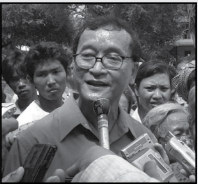
(ឯកឧត្តម សម រង្ស៊ី ប្រធានគណបក្សសមរង្ស៊ី)

ករណីឯកឧត្តម សម រង្ស៊ី ៖ តុលាការខេត្តស្វាយរៀងបានកាត់ទោសកំបាំងមុខឲ្យឯកឧត្តម សម រង្ស៊ី ជាប្រធាននាយកដ្ឋានចំនួន ២៧ កាលពីថ្ងៃទី២៧ មករា ២០១០ ពីបទបំផ្លាញទ្រព្យ សម្បត្តិសាធារណៈ និងញុះញង់ឲ្យមានការរើសអើងជាតិសាសន៍ ដោយសារតែតំណាងរាស្ត្ររូបនេះ បានដឹកនាំប្រជាពលរដ្ឋមួយចំនួនដកគម្រុយបង្គោលព្រំដែនកម្ពុជា-វៀតណាម លេខ ១៨៥ កាលពីថ្ងៃទី២៩ តុលា ២០០៩។ ក្តីមួយនេះ បានទាញពលរដ្ឋមួយចំនួនឲ្យមកពាក់ព័ន្ធនឹងការដាក់ពន្ធនាគារ ដោយអាចបន្សល់ត្រឹមបណ្តឹងខ្មោច និងបណ្តឹងសាទុក្ខដែល មិនអស់ចិត្តប៉ុណ្ណោះ។ សាលាខ្មោចបានកំណត់យកថ្ងៃទី ៩ ខែសីហា ឆ្នាំ២០១០ ដើម្បីបើកសវនាការជំនុំ ជម្រះ លោក សម រង្ស៊ី ប្រធានគណបក្សប្រឆាំងលើករណីបំផ្លាញតម្រុយបង្គោលព្រំដែនកម្ពុជា-វៀតណាម នៅស្រុកចន្ទ្រា