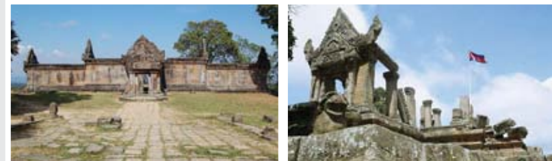
ប្រាសាទព្រះវិហាររបស់កម្ពុជា ដែលប្រទេសថៃសន្សំចិត្តបំបែកធ្វើជាម្ចាស់

»» ៨ សីហា ២០១០ ៖ ប្រមុខរាជរដ្ឋាភិបាលកម្ពុជា លោកនាយករដ្ឋមន្ត្រី ហ៊ុន សែន បានធ្វើលិខិតយ៉ាងប្រញាប់បំផុតមួយ ជូនប្រធានក្រុមប្រឹក្សាសន្តិសុខរបស់អង្គការសហប្រជាជាតិ និងប្រធានសភាអង្គការសហប្រជាជាតិ នៅក្នុងទីក្រុងញូវយ៉ក (New York) សហរដ្ឋអាមេរិក ដើម្បីប្តឹងអំពីរឿងព្រំដែន និងប្រាសាទព្រះវិហារ ដោយសារតែថែបានគំរាមប្រើកម្លាំងទ័ពដោះស្រាយ និងឈ្លានពានកម្ពុជា។ លិខិតការទូតនោះ បានពណ៌នាថា ផែនទីដែលបានចេញដោយគណៈកម្មាធិការបារាំង-សៀម គឺជាមូលដ្ឋានគ្រឹះយ៉ាងរឹងមាំ ដែលតុលាការយុត្តិធម៌អន្តរជាតិ បានកាត់សេចក្តីឲ្យកម្ពុជាឈ្នះក្តី កាលពីថ្ងៃទី១៥ ខែមិថុនា ឆ្នាំ១៩៦២។ ប្រាសាទព្រះវិហារស្ថិតនៅក្នុងបូរណភាពទឹកដីកម្ពុជា។ ប្រទេសថៃមានកាតព្វកិច្ចដកកងទ័ពចេញពីតំបន់ប្រាសាទ។