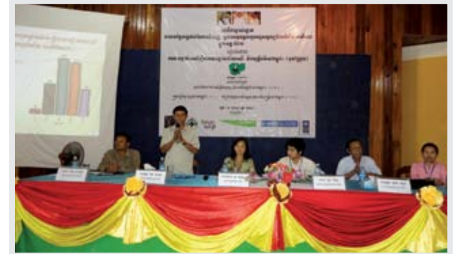
វេទិកាម្ចាស់ឆ្នោត កាលពី ខែកក្កដា ឆ្នាំ២០១០ នៅខេត្តកំពត

» ការចុះពង្រឹងផ្ទៃក្នុង និងបណ្តាញគណបក្ស ៖ តំណាងរាស្ត្រមកពី ៥ គណបក្ស បានចុះពង្រឹងផ្ទៃក្នុង និង បណ្តាញគណបក្សរបស់ខ្លួន ចំនួន ១៥៩ លើក ដែល គណបក្សសមរង្ស៊ី ឈានមុខគេដល់ទៅ ៧៧ លើក គណបក្សប្រជាជនកម្ពុជា បានចុះ ៧០ លើក និងគណបក្ស