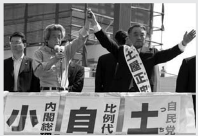
ការយោសនាបោះឆ្នោត ក្នុងឆ្នាំ២០០៥

អត្ថបទស្រាវជ្រាវ និងប្រែសម្រួលដោយ ៖ តែម ជាវិត្ត (តមកពី ព្រឹត្តិបត្រ អ្នកឃ្នាំមើល លេខ ៤១)