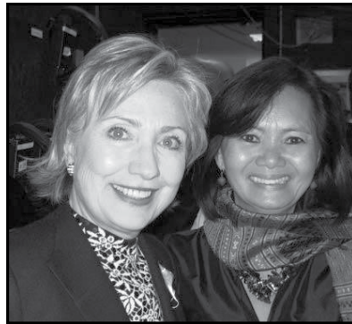
(លោកជំទាវ មូរ សុខហួរ តំណាងរាស្ត្រ គណបក្សសមរង្ស៊ី និងលោកស្រី Hillary Clinton Clinton រដ្ឋមន្ត្រី ក្រសួងការបរទេស សហរដ្ឋអាមេរិក ៖ The Kennedy Center 19 March, 2009)

ប្រសិនបើមិនមានកិច្ចសម្របសម្រួលតាមផ្នែកនយោបាយណាមួយ ឬការប្រទានលើកលែងទោសដោយព្រះមហាក្សត្រ សេចក្តីសម្រេចរបស់តុលាការខេត្តស្វាយរៀង កាត់ទោសឯកឧត្តម សម រង្ស៊ី ដាក់ពន្ធនាគារ ២ ឆ្នាំ បានដាក់ចំណាត់ថ្នាក់ទម្ងន់ទោសនៃបទល្មើស នៅត្រឹម បទមជ្ឈិម ដោយផ្អែកតាមច្បាប់ព្រហ្មទណ្ឌ និងនីតិវិធីព្រហ្មទណ្ឌសម្រាប់អនុវត្តនៅប្រទេសកម្ពុជា ក្នុងសម័យអន្តរកាល ១៩៩២ ទោះបីយ៉ាងនេះក្តី ទម្ងន់ទោសប៉ុណ្ណោះ ល្មមអាចនឹងឲ្យតំណាងរាស្ត្ររូបនេះបាត់បង់សិទ្ធិបោះឆ្នោត និងសិទ្ធិឈរឈ្មោះឲ្យគេបោះឆ្នោត នៅឆ្នាំ២០១៣ ខាងមុខ ព្រោះយោងតាមមាត្រា ១៤ នៃច្បាប់ស្តីពី លក្ខន្តិកៈតំណាង រាស្ត្រ ៖ តំណាងរាស្ត្រដែលមានសាលក្រមស្ថាពរ ឬសាលដីកាស្ថាពរ សម្រេចថាជា ទណ្ឌិតជាប់ពន្ធនាគារ ត្រូវបាត់បង់ទាំងស្រុងនូវសិទ្ធិ បុព្វសិទ្ធិ និងសមាជិកភាពជាសមាជិករដ្ឋសភា។