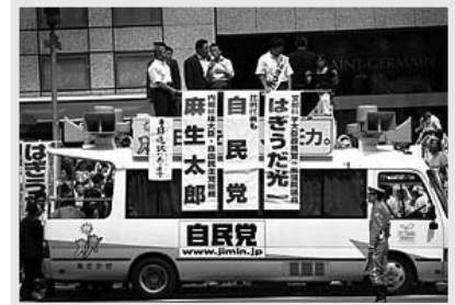
ការយោសនាបោះឆ្នោតឆ្នាំ ២០០៩ នៅប្រទេសជប៉ុន