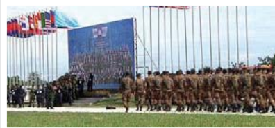
រូបភាព ៖ RFA (លំហាត់យោធាពហុសាសន៍ ឬឆ្នាំអង្គរ ២០១០)

រាប់ទាំងកម្ពុជា សហរដ្ឋអាមេរិក និងប្រទេសចិនផងដែរ ដើម្បីបង្កើនកិច្ចសហប្រតិបត្តិការ និងសមត្ថភាពក្នុងការថែរក្សាសន្តិភាពក្នុងតំបន់ និងពិភពលោក ។