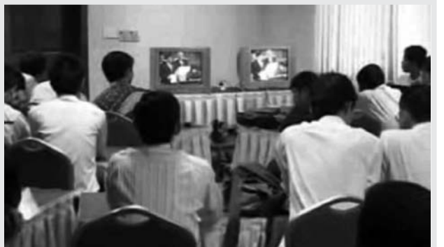
ក្រុមអ្នកយកព័ត៌មាន តាមដានសម័យប្រជុំនៃរដ្ឋសភាកម្ពុជា

មានអ្នកសារព័ត៌មាន ៣១ រូប ដែលត្រូវបានចាប់ខ្លួននៅក្នុងឆ្នាំ ២០០៩ កើនឡើងពីរដង បើធៀបទៅនឹងឆ្នាំ ២០០៨ ដែលមានត្រឹមតែ អ្នកសារព័ត៌មាន ១៤ រូប ដែលត្រូវបានចាប់ខ្លួន ដោយអាជ្ញាធរ។ អ្នកសារព័ត៌មាន