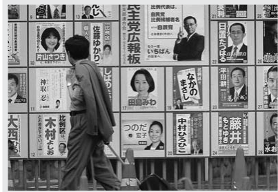
រូបភាពបេក្ខជនយោសនាបោះឆ្នោត ក្នុងឆ្នាំ២០១០

៣- ការដាក់ខ្សែអនុវត្តច្បាប់ស្តីពី មូលនិធិគណបក្សនយោបាយ ចំនួនថវិកាពិតប្រាកដ ដែលបានលើកឡើង មានការលំបាកក្នុងការធ្វើទិសស្រប។ ទោះបីយ៉ាងណាក៏ដោយ រដ្ឋមានច្បាប់ស្តីពីរបាយការណ៍លើមូលនិធិគណបក្សនយោបាយ ជាពិសេសសមាជិកនីមួយៗ នៃគណបក្សនយោបាយ ដែលមានភាពមិនជាក់លាក់នៅក្នុងរបាយការណ៍។ នៅដើមទសវត្សឆ្នាំ ១៩៩០ ត្រូវបានគេធ្វើការប៉ាន់ប្រមាណថា បេក្ខជនម្នាក់ៗចាំបាច់ត្រូវចំណាយរវាងពី ៥ ទៅ ៦ ដងច្រើនជាងអ្វីដែលបានអនុញ្ញាតដោយច្បាប់ (Ike 1957:200)។ មានក្រុមជាច្រើន ប្រសិនបើគេបានធ្វើការកត់សម្គាល់អត្តសញ្ញាណ ត្រូវតម្រូវឲ្យធ្វើរបាយការណ៍ពីចំណូលរបស់ខ្លួន ប៉ុន្តែពេលខ្លះ គេជ្រើសយក ដោយធ្វើការបែងចែកថវិកាដែលទទួលបានជាលក្ខណៈបុគ្គលនៅក្នុងក្រុម ឬបក្សពួក