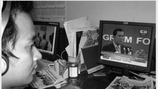
ក្រុមការងារខុមហ្វ្រែល អង្កេតមើលរដ្ឋាភិបាលតាមរយៈប្រព័ន្ធផ្សព្វផ្សាយ

មហាសេដ្ឋីដែលជាសម្ព័ន្ធនឹងគណបក្សកាន់អំណាច ឬ ក្រុមគ្រួសារនៃសមាជិករាជរដ្ឋាភិបាល និងគណបក្សប្រជាជនកម្ពុជា។ ជាលទ្ធផល គេសង្កេតឃើញថា នាទីព័ត៌មាន ដែលបានផ្សព្វផ្សាយតាមកញ្ចក់ទូរទស្សន៍កម្ពុជា ជាទៀងទាត់ ផ្សព្វផ្សាយសន្តិសីទ ដែលបានបង្ហាញ មន្ត្រីរាជរដ្ឋាភិបាលកម្ពុជា និយាយនៅពេលប្រជុំ ចំណែកជម្លោះដីធ្លី ដែលមានជឿយៗ គេមិនអាចប្រទះឃើញព័ត៌មានទាំងនេះលើកញ្ចក់ទូរទស្សន៍ទាល់តែសោះ។ ប្រព័ន្ធផ្សព្វផ្សាយតាមទូរទស្សន៍ ក៏ជួយលើកស្ទួយគណបក្សកាន់អំណាចផងដែរ ដោយការបង្ហាញរូបភាព និងសកម្មភាពសមាជិករាជរដ្ឋាភិបាល និងគណបក្សកាន់អំណាចចែកអំណោយទៅដល់ជនក្រីក្រ ឬទៅដល់ទាហាននៅប្រាសាទ