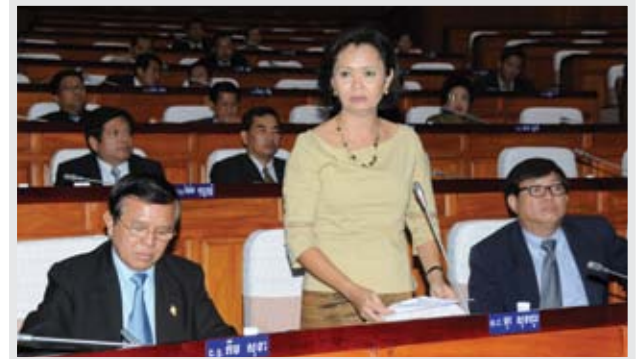
តំណាងរាស្ត្រ ឡើងបញ្ចេញមតិក្នុងពេលប្រជុំពេញអង្គនៃរដ្ឋសភា

» ការសាកសួរសុខទុក្ខ ចែកអំណោយ និងសម្តែង គម្រោងនានា ៖ ត្រូវបានធ្វើឡើងដោយតំណាងរាស្ត្រមកពី ៣ គណបក្ស ដែលគណបក្សប្រជាជនកម្ពុជា ឈានមុខ គេ ចំនួន ១៥១ លើក លើគណបក្សសមរង្ស៊ី ដែលចុះ មូលដ្ឋានដើម្បីសួរសុខទុក្ខ ចែកអំណោយ និងសម្តែង