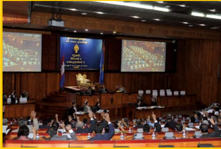
សមាជិក នៃរដ្ឋសភា បើកសម័យប្រជុំរបស់ខ្លួន នៅវិមានរដ្ឋសភា កាលពីខែឧសភា ឆ្នាំ២០១០

រដ្ឋាភិបាលកម្ពុជា មានបំណងដើម្បី កំណត់មុខងារសេរីភាពប្រជាធិបតេយ្យ ដែល នៅក្នុងអំណាចទាំងបី របស់រាជរដ្ឋាភិបាល (នីតិប្បញ្ញត្តិ នីតិប្រតិបត្តិ និងតុលាការ) អំណាចនីមួយៗ បំពេញមុខងារជា ព្រំដែន ឬ រក្សាតុល្យភាពនៃអំណាចដទៃទៀត។ ទោះបីជា យ៉ាងណា នៅក្នុងការអនុវត្តជាក់ស្តែង អំណាច នីតិប្បញ្ញត្តិ និង តុលាការ មិនទាន់បានជោគជ័យនៅក្នុង ការអនុវត្តជាព្រំដែនសម្រាប់កំណត់អំណាចនីតិប្រតិបត្តិ របស់រាជរដ្ឋាភិបាល។ លទ្ធផលទាំងនេះ ចេញមកពី ការត្រួតពិនិត្យលើអ្នកតំណាងរាស្ត្រ ដោយគណបក្សរបស់ ពួកគេ និងមានយុទ្ធសាស្ត្រជាច្រើនទៀត ដើម្បីជាការរារាំង គណបក្សប្រឆាំងនៅក្នុងរដ្ឋសភា ដោយកំណត់ដែនកំណត់ លើកិច្ចពិភាក្សាដេញដោលនៅក្នុងរដ្ឋសភា និងសម្លេង ភាគច្រើន ដែលបានគ្រប់គ្រងដោយគណបក្សកាន់ អំណាច អំឡុងពេលអាណត្តិបច្ចុប្បន្ន។ ការជជែកពិភាក្សា នៅក្នុងរដ្ឋសភាបច្ចុប្បន្នបានកំណត់ បន្ថែមទៀតដោយកត្តា ពីរ ៖ ពហិការរបស់គណបក្សប្រឆាំង ក្នុងការចូលជាសមាជិក គណៈកម្មាធិការរដ្ឋសភា និង ដែនកំណត់ដែលបានដាក់សម្រាប់កិច្ចពិភាក្សានៅពេល កិច្ចប្រជុំពេញអង្គនៃរដ្ឋសភា ដោយគណបក្សកាន់អំណាច /រដ្ឋាភិបាល។ របាយការណ៍ឃ្នាំមើលសភា របស់ ខុមហ្វ្រែល បានលាតត្រដាងថា តំណាងរាស្ត្រ ២ រូប បាន លាលែង ពីគណបក្សប្រជាជនកម្ពុជា ក្នុងឆ្នាំ ២០០៩ ប៉ុន្តែមូលហេតុ នៃការលាលែងរបស់ពួកគេ មិនច្បាស់លាស់ទេ។ បន្ថែមពីនេះទៀត នៅក្នុងករណីខ្លះ រាជរដ្ឋាភិបាល កម្ពុជាបានស្នើថា ច្បាប់ពិតប្រាកដគួរតែ អនុម័តឲ្យបាន