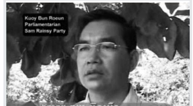
តំណាងរាស្ត្រគណបក្សសមរង្ស៊ី បង្ហាញទស្សនៈតាមកម្មវិធីទូរទស្សន៍សមធម៌

ប្រពន្ធផ្សព្វផ្សាយតាមទូរទស្សន៍ គឺគ្របសង្កត់យ៉ាងលើសលប់ដោយគណបក្សកាន់អំណាច ឬ សម្ព័ន្ធមិត្តរបស់ខ្លួន នៅក្នុងសហគមន៍ពាណិជ្ជកម្ម។ គណបក្សប្រឆាំងមិនអាចប្រើប្រាស់ការផ្សព្វផ្សាយតាមទូរទស្សន៍ឡើយ លើកលែងតែនៅក្នុងកម្មវិធីទូរទស្សន៍តែមួយគត់ គឺកម្មវិធីសមធម៌ របស់ទូរទស្សន៍ជាតិកម្ពុជាដែលបាន ឧបត្ថម្ភដោយ