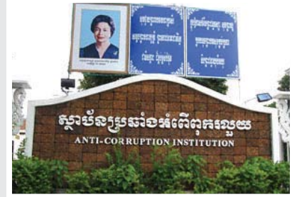
រូបភាព ៖ RFA (ស្ថាប័នប្រឆាំងអំពើពុករលួយនៃព្រះរាជាណាចក្រកម្ពុជា)

»» ១៤ កក្កដា ២០១០ ៖ ប្រធានអង្គការប្រឆាំងអំពើពុករលួយ និងជាសមាជិកក្រុមប្រឹក្សាជាតិប្រឆាំងអំពើពុករលួយ លោក ឌឹម យ៉ុនឡេង បានប្រកាសយកខែវិច្ឆិកា ២០១០ ដើម្បី ចាប់ផ្តើមនីតិវិធីប្រកាសទ្រព្យសម្បត្តិរបស់មេដឹកនាំរដ្ឋាភិបាល មន្ត្រីរាជការស៊ីវិលដែលត្រូវបានតែងតាំងដោយព្រះរាជក្រឹត្យ និងអនុក្រឹត្យ តំណាងរាស្ត្រ និងសមាជិកនៃព្រឹទ្ធសភា មេដឹកនាំអង្គការសង្គមស៊ីវិល ក្រុមហ៊ុនឯកជនធំៗ មន្ត្រីជាន់ខ្ពស់ និងព្រមទាំងមន្ត្រី និងសមាជិកនៃស្ថាប័នប្រឆាំងអំពើពុករលួយផងដែរ សរុបប្រមាណជាង ១០ ម៉ឺននាក់។