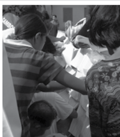
(អ្នកបោះឆ្នោត ជាច្រើននៅតែ ពិបាកករណ៍របស់ខ្លួន នៅពេលបោះឆ្នោត)