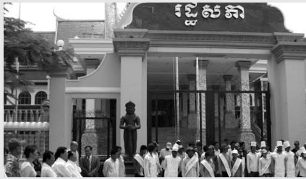
ក្រុមការងារខុមហ្វ្រែល អង្កេតមើលរដ្ឋាភិបាលតាមរយៈប្រព័ន្ធផ្សព្វផ្សាយ

នៅក្នុងខែមេសា ខែឧសភា និងខែមិថុនា ឆ្នាំ២០១០នេះ ដែលជាពេលវេលាសមស្រប និងប្រជុំពេញអង្គឡើងវិញ សម្រាប់ឲ្យអ្នកតំណាងរាស្ត្រធ្វើការអនុម័តសេចក្តីព្រាង ច្បាប់ផ្សេងៗ ហើយខែកក្កដា នៃវិស្សមកាលរបស់តំណាង រាស្ត្រសម្រាប់ចុះជួបប្រជាជន ខុមហ្វ្រែល អង្កេតឃើញថា មិនសូវមានអ្នកតំណាងរាស្ត្រចុះមូលដ្ឋានប៉ុន្មានទេ។ មាន អ្នកតំណាងរាស្ត្រចំនួន ៧៦ រូប មកពីគណបក្សជាប់ឆ្នោត