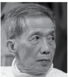
(កាំង ហ្គេកអ៊ាវ ហៅខុច អតីតមេតុកទូលស្នែង ឬមន្ទីរ ស-២១)

»» ២៦ កក្កដា ២០១០ ៖ អង្គជំនុំសាលាដំបូងនៃអង្គជំនុំជម្រះវិសាមញ្ញក្នុងតុលាការកម្ពុជា (អ.វ.ត.ក) បានប្រកាសសាលក្រមលើសំណុំរឿង០០១ ទាក់ទងនឹងជនជាប់ចោទ កាំង ហ្គេក អ៊ាវ ហៅខុច សម្រេចឲ្យជាប់ពន្ធនាគារ ៣៥ ឆ្នាំ។ ចំពោះការអនុវត្តទោស អ.វ.ត.ក ក៏បាន សម្រាលទោសមកនៅត្រឹម ១៩ ឆ្នាំ ដោយសារ ខុច ត្រូវបានឃុំខ្លួនមុនពេលសម្រេចទោសជាង ១១ ឆ្នាំ ហើយបានសហការជាមួយនឹង អ.វ.ត.ក ក្នុងពេលបើកសវនាការ។ មេធាវីការពារ ខុ ច លោក ការ សាវុត្ត និងមេធាវីការពារដើមបណ្តឹងរដ្ឋប្បវេណី មានគម្រោងប្តឹងសារទុក្ខ ខណៈដែល មានប្រតិកម្មជាច្រើនអំពីសាលក្រមមួយនេះ។ តាមនីតិវិធី ភាគីទាំងសង្វាង មានរយៈពេល ៣០ ថ្ងៃ ដើម្បីដាក់ពាក្យបណ្តឹង។