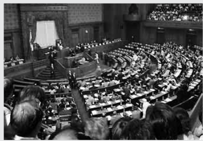
សភាប្រទេសជប៉ុនបើកប្រជុំ ក្នុងឆ្នាំ២០០៥