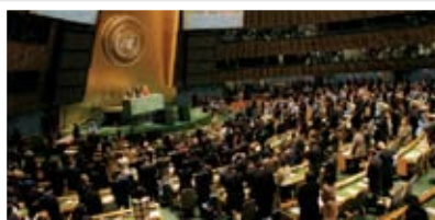
រូបភាព ៖ AP (មហាសន្និបាតអង្គការសហប្រជាជាតិ)

»» ១៣ កក្កដា ២០១០ ៖ ប្រធានស្នងការជាន់ខ្ពស់អង្គការសហប្រជាជាតិ ទទួលបន្ទុកផ្នែកសិទ្ធិមនុស្ស លោកស្រី ណារី ភីលីយ (Navy Pillay) បានហៅករណីលោកស្រី មូរ សុខហួរ ដែលតុលាការកម្ពុជាកាត់ក្តីឲ្យចាញ់លោកនាយករដ្ឋមន្ត្រី ហើយត្រូវសងប្រាក់ពិន័យ និងជំងឺចិត្តលោក ហ៊ុន សែន ចំនួន ១៦,៥លានរៀល ថា ជាការប្រកាសអាសន្នចំពោះការធ្លាក់ចុះសិទ្ធិសេរីភាពនៅប្រទេសកម្ពុជា។