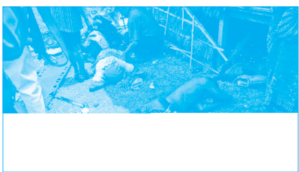
CnrgelKaleday\&sarkarGnwt\&sal Rkm -bnaymanC\&y! enAk\&uyry\&eBl eT\&EtCitm\&yq\&nl\&nb\&Bkarcab;

ep\&hGa\&Nt\&t\&B\&beN\&H raCrd\&aP\&i)al km\&\&a)anRb\&kas kar EkTRmgkarRKbRKgdF\&sac\&hsaeL\&g edayGHGagG\&Bl p\&l RbeyaCnedm, katbn\&fyPaBRkRk. ey\&gseg\&t eX\&ij fa RtL\&beTA RtL\&bmk RbCaBl rden\&A\&tk\&andF\&b nigkarr\&M aPyk\&dF\&edayK\&n\&l T\&PaBed\&ar\&rsayR\&tmR\&t\&U Brd\&aP\&i)al en\&A\&etbn\&p eh\&ly\&py\&eT\&Avij rd\&aP\&i)al )anyk cit\&ik\&dakGnwt\&ic\&S\&nuasm, Tanesd\&ke\&TA [Rkm\&h\&n ÉkCn. erOgEd\& Q\&Wabb\&ut Ed\& tRm\&U [mankaryk\&cit\&p Tikdaked\&ar\&rsayCammen\&h\&K\&B\&Ba\&t\&Mas\&dF\&b nigkar