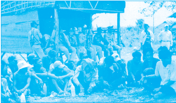
អាជ្ញាធរដាក់ខ្លួនអ្នកប្រឆាំងសាសនាគ្រុម (បន្ទាយមានជ័យ)

Gnwtphsal dkarbs:tu akarmlycMhBakBkBaadFb EdI )anbNpl [manrhldl karsmabGikPthknogmk CahEhTaldenAfakCatinigfakml dandEdI manray karN_nigevTkasEmgmtCasaFarN 3 Caerch)anbgaj BkrNITMasdFbvagGikmanGINac RkinhntTV )an សម្បទានជាមួយនិងប្រជាពលរដ្ឋ ហើយអាជ្ញាធរមានសមត្ថកិច្ច min)an eFlkaredaHrsaymanRbsitPaBeLly.