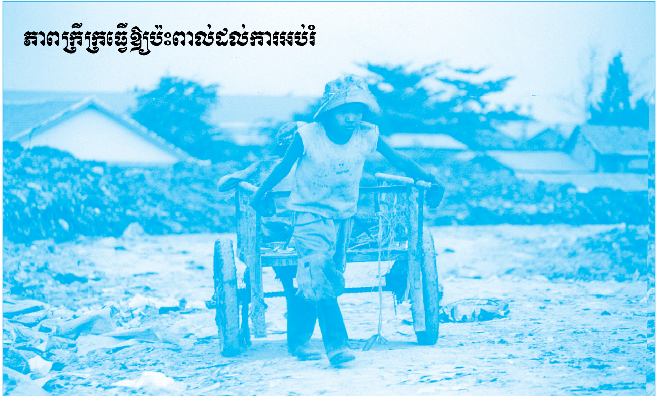
ភាពក្រីក្រធ្វើឱ្យប៉ះពាល់ដល់ការអប់រំ

G g k a r - s m a k m s g h n s u i l r h C a m Y n i g R K U បង្រៀន សាស្ត្រាចារ្យ សិស្ស និងគ្រូបង្រៀនតាមដានឃ្នាំមើលការ G n u t p nig G h a v n a v [ r d a P i) a l x i t x R b o y E R b g b E n h e T o t k 1 g k a r e F l [ R b e s t e L g d l K I N P a B G b r M t a t i E d l C a ] b k r N s M a n; c M B a h k a r s b b n a F n F a n m n s S nig k a r G P i D / A n R b e T s r y 3 e B l E v g m a n c i P a B ។