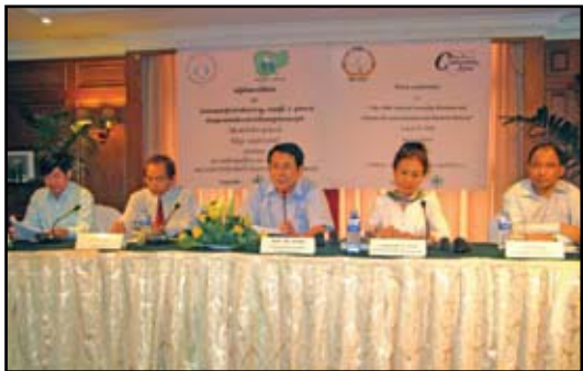
សន្និសីទសារព័ត៌មានរបស់អង្គការសង្គមស៊ីវិល

សម្ព័ន្ធអង្គការសង្គមស៊ីវិល មានដូចជា គណៈកម្មាធិការខុមហ្វ្រែល គណៈកម្មាធិការប្រព្រឹត្តិកម្ម គណៈកម្មាធិការនីតិវិធី វេទិកានៃប្រជាពលរដ្ឋស្តីពីកម្ពុជា-ប្រទេសជប៉ុន PEFOC,J (ដែលមានអង្គការ-សមាគមសរុបចំនួន ៦៤ ជាសមាជិក១) យល់ឃើញថា បរិយាកាសសន្តិសុខ ជាទូទៅ នៅថ្ងៃបោះឆ្នោត ថ្ងៃរាប់សន្លឹកឆ្នោត និងក្រោយពេលបោះឆ្នោត បានប្រព្រឹត្តទៅដោយសន្តិភាព លើកលែងតែនៅមុនថ្ងៃបោះឆ្នោត ដែលនៅមានបរិយាកាសគំរាមកំហែង បំភិតបំភ័យ ចំពោះសេរីភាពក្នុងការចូលរួមខាងនយោបាយ និងការបញ្ចេញមតិ ។