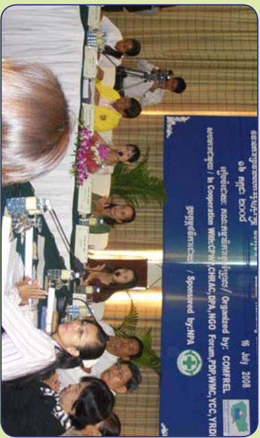
វេទិកាពិភាក្សានយោបាយស្តីពីវិធានការប្រឆាំងការរុញដូរស្ត្រី និងកុមារ រៀបចំដោយខុមហ្វ្រែល