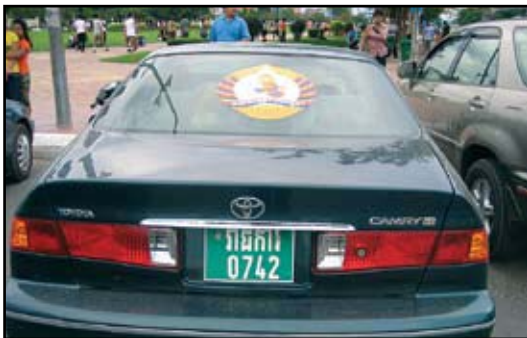
ការប្រើប្រាស់យានយន្តរដ្ឋសំរាប់គណបក្ស

បរិយាកាស និងដំណើរការបោះឆ្នោតមិនទាន់ធានាបាននូវភាពអព្យាក្រឹត និងយុត្តិធម៌បាននៅឡើយទេ ដោយសារ តែមានការប្រើប្រាស់ធនធានរដ្ឋ និងការចូលរួមពីសំណាក់មន្ត្រីរាជការអាជ្ញាធរ និងកង