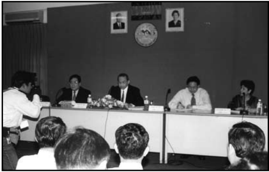
សវនាការរបស់ គ.ជ.ប កន្លងមក

ដំណើរការដោះស្រាយបណ្តឹងតវ៉ាលើលទ្ធផលបណ្តោះអាសន្ននៃការបោះឆ្នោតជ្រើសតាំងតំណាងរាស្ត្រ ទាំងក្របខ័ណ្ឌច្បាប់ និងការអនុវត្តស្ថិតនៅក្នុងកិច្ចការការិយាល័យនៅឡើយ ។ បញ្ហានៃច្បាប់បោះឆ្នោត ដែលផ្តល់ ពេលវេលាត្រឹមតែ ៤៨ ម៉ោងដល់ គណៈកម្មាធិការជាតិរៀបចំការបោះឆ្នោត (គ.ជ.ប) សំរាប់ដោះស្រាយបណ្តឹងថ្នាក់ ជាតិស្តីពីលទ្ធផលនៃការបោះឆ្នោត ជាចេតនាជំរុញ ឱ្យ គ.ជ.ប ត្រូវតែចាត់វិធានការបន្ទាន់បង្អែកក្នុងការចេញសេចក្តី សំរេចរបស់ខ្លួន ។ គ.ជ.ប ខ្លះទទួលខុសត្រូវដែលមិនព្យាយាមធ្វើការ ស៊ើបអង្កេត សាកសួរយកព័ត៌មានបន្ថែម និង បើកសវនាការជាសាធារណៈ ដើម្បីដោះស្រាយបណ្តឹងរបស់គណបក្សនយោបាយ ទេ ។ ជាការពិត គ.ជ.ប មិនធ្លាប់ ទាល់តែសោះក្នុងការលើកឡើងនូវគំនិតផ្តួចផ្តើមស្នើឱ្យធ្វើវិសោធនកម្មច្បាប់ បោះឆ្នោតពាក់ព័ន្ធនឹងការ កំណត់ពេលវេលាក្នុងការដោះស្រាយបណ្តឹងនេះ បើទោះបីជា គ.ជ.ប ធ្លាប់បានជួបប្រទះក្នុងការអនុវត្តនោះយ៉ាងណាក៏ដោយ ។ ដោយផ្អែកផ្តល់នឹងខ្លឹមសារខាងលើនេះ គ.ជ.ប បានត្រឹមតែអះអាងថា គ.ជ.ប គ្មានពេលវេលាគ្រប់គ្រាន់ ជាស្ថាប័នអនុវត្ត តាមច្បាប់ គោរពច្បាប់តែប៉ុណ្ណោះ ។ ក្នុងការអនុវត្ត គ.ជ.ប បានព្យាយាមចេញសេចក្តីសំរេចរបស់ខ្លួនឱ្យបានឆាប់រហ័ស បំផុតតាមដែលអាចធ្វើទៅ បាន ដើម្បីបញ្ជូនសំណុំរឿងឱ្យផុតពីស្ថាប័នរបស់ខ្លួន ហើយឱ្យគណបក្សនយោបាយប្តឹងបន្ត ទៅក្រុមប្រឹក្សាធម្មនុញ្ញ ដែលជាស្ថាប័នមាន សិទ្ធិធ្វើសេចក្តីសំរេចចុងក្រោយ បិទផ្លូវតវ៉ាតែម្តង ។