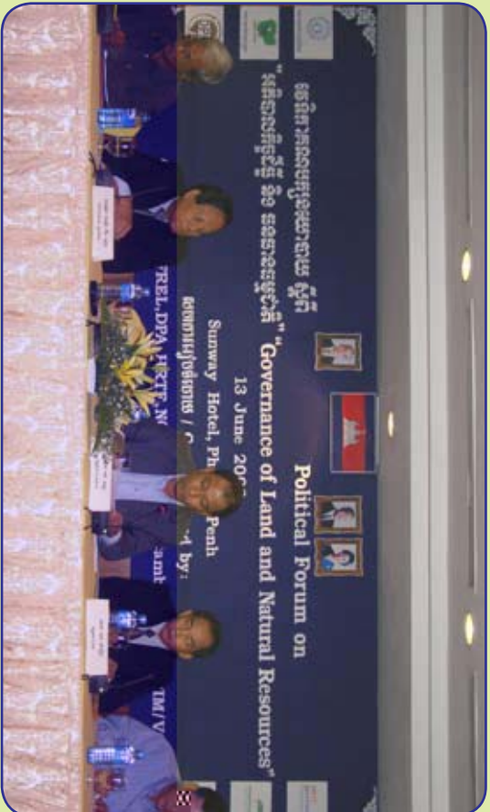
វេទិកាគណបក្សនយោបាយស្តីពី អភិបាលកិច្ចដីធ្លី និងធនធានធម្មជាតិរៀបចំឡើង ដោយ សមាគមអង្គការមិនមែនរដ្ឋាភិបាល