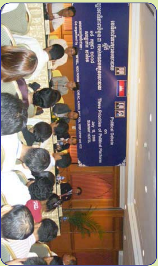
វេទិកាពិភាក្សានយោបាយស្តីពីបញ្ហាអាទិភាពចំនួនបីរបស់គណបក្សនយោបាយ