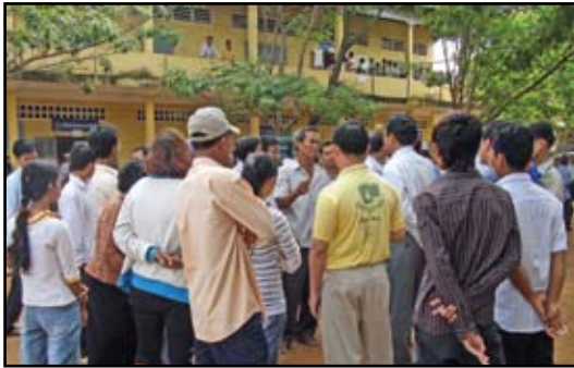
អ្នកបោះឆ្នោតតវ៉ាពេលបាត់ឈ្មោះពីបញ្ជីបោះឆ្នោត

សម្ព័ន្ធអង្គការសង្គមស៊ីវិល វាយតម្លៃដំណើរការរៀបចំបាត់ថែងការបោះឆ្នោតថា នៅមានភាពមិនប្រក្រតីជាច្រើន ជាពិសេស យើងមានការសោកស្តាយចំពោះអ្នកបោះឆ្នោតបានទៅការិយាល័យបោះឆ្នោតប៉ុន្តែបានជួបឧបសគ្គ ដែលនាំឱ្យបាត់សិទ្ធិអ្នកបោះឆ្នោតដ៏ច្រើនជាងការបោះឆ្នោតមុនៗ ។ ការបាត់សិទ្ធិអ្នកបោះឆ្នោតនេះ ត្រូវបានកើតឡើងដោយសារ បច្ចេកទេសនីតិវិធី និងការសង្ស័យថាជាចេតនានយោបាយផងដែរ បណ្តាលមកពីភាពខ្វះការទទួលខុសត្រូវរបស់ គ.ជ.ប និងអាជ្ញាធរមូលដ្ឋានឃុំ សង្កាត់ ក្នុងការចុះឈ្មោះអ្នកបោះឆ្នោតការធ្វើបច្ចុប្បន្នភាពបញ្ជីឈ្មោះអ្នកបោះឆ្នោត ការសម្អាត បញ្ជីឈ្មោះអ្នក