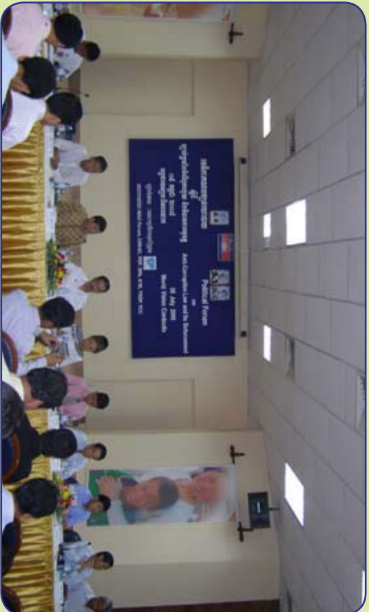
វេទិកាពិភាក្សានយោបាយស្តីពីវិធានការប្រឆាំងអំពើពុករលួយ