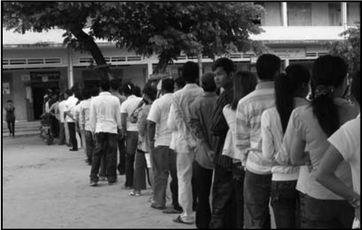
ប្រជាពលរដ្ឋតម្រង់ជួរចូលបោះឆ្នោត

ជាគោលការណ៍ប្រព័ន្ធតំណាងសមាមាត្រត្រូវបានប្រើសំរាប់មណ្ឌលបោះឆ្នោតដែលមានអាសនៈចាប់ពី២ឡើងទៅ ។ តែនៅ កម្ពុជា មានខេត្ត ក្រុងចំនួន ៩ ដែលមានអាសនៈតែ១ ក៏ត្រូវតែប្រើប្រព័ន្ធតំណាងសមាមាត្រនេះផងដែរ ( ក្រុងកែប ក្រុងព្រះសីហនុ ខេត្តកោះកុង ក្រុងប៉ៃលិន ខេត្តឧត្តរមានជ័យ ព្រះវិហារ ស្ទឹងត្រែង រតនគិរីនិងមណ្ឌលគិរី) ។ តាមការពិត ស្របតាមស្ថានភាពភូមិសាស្ត្រ ជាក់ស្តែង ខេត្ត ក្រុងទាំង៩នេះ គួរតែរៀបចំការបោះឆ្នោតតាមប្រព័ន្ធ ឯកត្តនាមដែលបេក្ខជនឈរឈ្មោះជាបុគ្គល ឬយ៉ាងហោចណាស់ គួរប្រើប្រព័ន្ធភាគច្រើននិយមដោយបញ្ជី (Système Majoritaire de List) ហើយបើកចំហដល់ក្រុមបេក្ខជនឯករាជ្យអាចចូលរួម ប្រកួតប្រជែងផងដែរ ។