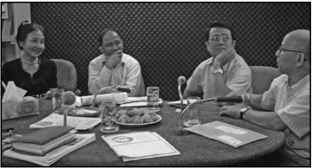
កិច្ចពិភាក្សាក្នុងកម្មវិធីសំឡេងសង្គមស៊ីវិល

ជាពិសេសយោងទៅតាម របាយការណ៍សង្កេតតាមដានសកម្មភាពអ្នកតំណាងរាស្ត្រ និងសភា ដែលបានចេញផ្សាយជាទៀងទាត់រៀងរាល់ខែកន្លងមករបស់គណកម្មាធិការខុមហ្វ្រែល ឃើញថាការអនុវត្តរបស់ឯកឧត្តម លោកជំទាវសមាជិក សមាជិការដ្ឋសភាក្នុងតួនាទីបម្រើផលប្រយោជន៍ជូនម្ចាស់ឆ្នោតនៅមានតិចតួចនៅឡើយ ។