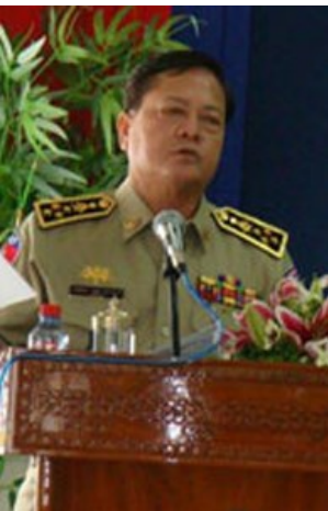
អគ្គស្នងការនគរបាលជាតិ លោក នាយឧត្តមសេនីយ៍ នេត្រ សារឿន

ថ្ងៃទី២៨ ខែសីហា ៖ អគ្គស្នងការ នគរបាលជាតិ លោកនាយឧត្តម សេនីយ៍ នេត្រ សារឿន បានកោះ ប្រជុំជាបន្ទាន់មួយ ជាមួយម្ចាស់បន ល្បែងចំនួន៦១ នៅប្រទេសកម្ពុជា ដើម្បីពិភាក្សា និងចាត់វិធានការកាត់ បន្ថយបទល្មើសឧក្រិដ្ឋកម្ម ដែល បានកើតមានកន្លងមក។ ក្រោយ ជំនួបបិទទ្វាររយៈពេល ២ម៉ោង