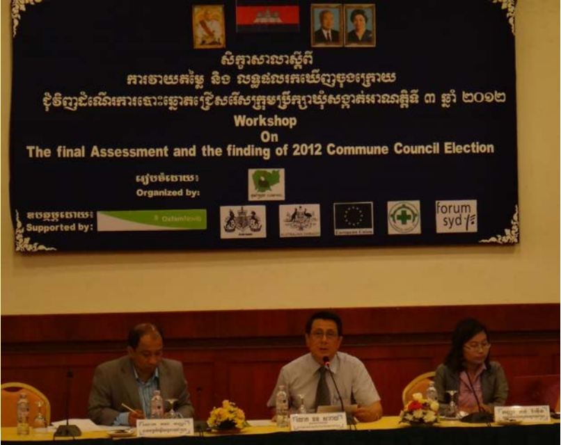
ខុមហ្វ្រែល បានចូលរួមសង្កេតការណ៍បោះឆ្នោត និងចេញរបាយការណ៍វាយតម្លៃក្នុងឆ្នាំ២០១២

បេសកកម្ម: បេសកកម្មរបស់ខុមហ្វ្រែល គឺជួយបង្កើតបរិយាកាសយោគ យល់ និងដឹងឮសុខុមសាយ ទី១/ដល់ការបោះឆ្នោតដោយសេរី និង យុត្តិធម៌ តាមរយៈការបញ្ចុះបញ្ចូល និងការតស៊ូមតិឱ្យមាន គម្រោងការ គតិយុត្តិសមស្របមួយ មានការអប់រំផ្តល់ព័ត៌មានដល់អ្នកបោះឆ្នោតអំពី សិទ្ធិរបស់ពួកគេ និងមានសកម្មភាពអង្កេតឃ្លាំមើលដែលកាត់បន្ថយ ភាពមិនប្រក្រតី ហើយផ្តល់ទិន្នន័យអង្កេតដែលអនុញ្ញាតឱ្យមានការ វាយតម្លៃមិនលម្អៀង និងជាក់ច្បាស់ចំពោះដំណើរការបោះឆ្នោត។ ទី២/ សម្រាប់សារសំខាន់ប្រកបដោយអត្ថន័យនៅក្រោយការបោះឆ្នោត តាមរយៈការអប់រំ និងវេទិកាសាធារណៈនានាដើម្បីជំរុញឱ្យប្រជាពល រដ្ឋចូលរួមក្នុងនយោបាយ និងការធ្វើសេចក្តីសម្រេចចិត្ត ការតស៊ូមតិ/ បញ្ចុះបញ្ចូលឱ្យមានកំណែទម្រង់ការបោះឆ្នោតដែលបង្កើននូវគណនេ យ្យភាពរបស់មន្ត្រីជាប់ឆ្នោត ហើយផ្តល់ឱ្យទិន្នន័យអង្កេតដែលនាំទៅ