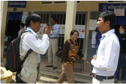
អ្នកសារព័ត៌មានសម្ភាសន៍ យុវជនម្នាក់ ជា មន្ត្រីការិយាល័យ រៀបចំការបោះឆ្នោត ក្នុងរាជធានីភ្នំពេញ (កាលពីថ្ងៃទី០៦ ខែ មិថុនា ឆ្នាំ២០១២)

គណបក្សសមរង្ស៊ី គណបក្សសិទ្ធិមនុស្ស គណបក្សហ៊្វិនស៊ិនប៉ិច និងគណបក្សនរោត្តមរណប្បទិ ក៏បានបង្កើតចលនាយុវជនរបស់គណបក្សខ្លួនផងដែរ។ រហូតមកដល់ពេលនេះគណបក្សនយោបាយទាំងអស់នៅមិនទាន់មានសញ្ញាណអ្វីជាក់លាក់ ឬបានចែងនៅក្នុងគោលនយោបាយគណបក្សទាំងនោះ ដោយគិតគូរអំពីផលប្រយោជន៍ និងផ្តល់ឱកាសសម្រាប់យុវជន ដើម្បីទទួលបាននូវឋានៈ និងតួនាទីក្នុងគណបក្សនៅឡើយទេ ក្រៅតែពីការអូសទាញយុវជនឲ្យធ្វើសកម្មភាព និងបោះឆ្នោតគាំទ្រគណបក្សខ្លួនប៉ុណ្ណោះ។ ទោះបីជាមិនទាន់មានតួលេខពិតប្រាកដពីចំនួនយុវជនឈរឈ្មោះបោះឆ្នោត និងយុវជនជាប់ឆ្នោតក្នុងការបោះឆ្នោតជ្រើសរើសក្រុមប្រឹក្សាឃុំ-សង្កាត់ឆ្នាំ២០១២ តែជាក់ស្តែងយុវជនជាច្រើនបានចាប់ផ្តើមងាកមកចាប់អារម្មណ៍កិច្ចការនយោបាយ តាមរយៈការចូលរួមជាសមាជិកសកម្មរបស់គណបក្សនយោបាយ ហើយបានចូលរួមក្នុងយុទ្ធនាការយោសនាបោះឆ្នោតយ៉ាងគ្រឹកគ្រេងជាងការបោះឆ្នោតឃុំ-សង្កាត់អាណត្តិមុន។