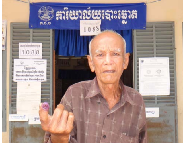
អ្នកបោះឆ្នោតបង្ហាញប្រាមដៃប្រឡាក់ទឹកខ្មៅ បញ្ជាក់បានបោះឆ្នោតជ្រើស រើសក្រុមប្រឹក្សាឃុំ សង្កាត់ អាណត្តិទី៣ កាលពីថ្ងៃទី៣ ខែមិថុនា ឆ្នាំ២០១២

ថ្នាក់ក្រោមជាតិ ។ ផ្ទុយទៅវិញ គណបក្សហ៊្វុនស៊ិនប៉ិច និង/ឬ គណបក្សជាតិនិយម អាចនឹងបាត់បង់អាសនៈដ៏ច្រើនរបស់ ខ្លួនសម្រាប់ការបោះឆ្នោតជ្រើសតាំងតំណាងរាស្ត្រអាណត្តិទី ៥។ ប៉ុន្តែលទ្ធផលសន្លឹកឆ្នោតខាងមុខក៏អាចប្រែប្រួលខ្លះថែម ទៀត នៅពេលអ្នកមិនបានបោះឆ្នោតនៅឆ្នាំ២០១២ និងអ្នកចុះ ឈ្មោះបោះឆ្នោតថ្មី ប្រមាណ ៣លាន ៥សែន នាក់ ចេញមក បោះឆ្នោតក្នុងនោះជាង ៥០% ដែលបាត់បង់ទឹកចិត្តរឿងបញ្ហា នយោបាយ។ ការបោះឆ្នោតខាងមុខ អាចលេចចេញតែក្រុម គណបក្សនយោបាយប្រកួតប្រជែងពីរលេចធ្លោរ គឺគណបក្ស ប្រជាជនកម្ពុជា និងគណបក្សជំទាស់ គណបក្សសង្គ្រោះជាតិ។ បរិយាកាស និងដំណើរការបោះឆ្នោត អាចនៅបន្តមានបញ្ហា មិនទាន់សេរី យុត្តិធម៌ និងតម្លាភាពពេញលេញដដែល។ ភាព ជឿជាក់ និងនីត្យានុកូលភាពនៃលទ្ធផលបោះឆ្នោតលើកនេះ ក៏ នឹងធ្លាក់ចុះយ៉ាងខ្លាំង ដោយសារគ្មានការចូលរួមពេញលេញ ពី គណបក្សជំទាស់ក្នុងការរៀបចំ និងត្រួតពិនិត្យការជ្រើសរើស សមាសភាព គ.ជ.ប គ្រប់លំដាប់ថ្នាក់ មេដឹកនាំគណបក្ស ជំទាស់មិនអាចឈរឈ្មោះបោះឆ្នោត និងដឹកនាំគាំទ្រគណបក្ស ខ្លួនក្នុងការប្រកួតប្រជែងបោះឆ្នោតនេះផ្ទាល់នៅក្នុងប្រទេស បានទេ។