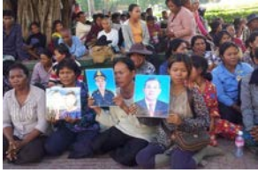
ពលរដ្ឋរងគ្រោះព្រោះជម្លោះដីធ្លី មកពីខេត្តព្រះវិហារ

ខែមករា ឆ្នាំ២០១២ ៖ អង្គការឃ្លាំមើលសិទ្ធិមនុស្សអន្តរជាតិ (Human Rights Watch) បានចេញរបាយការណ៍សង្ខេបប្រចាំប្រទេសមួយរំលឹកអំពីការរំលោភសិទ្ធិមនុស្សនៅកម្ពុជាថា ចាប់តាំងពីឆ្នាំ២០០៧ មកទល់សព្វថ្ងៃ មានការដកហូតយកដីធ្លី និងការបណ្តេញពលរដ្ឋចេញពីលំនៅទាំងបង្ខំ ដែលជាការរំលោភ