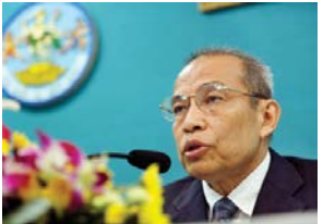
ឯកឧត្តម អ៊ឹម សូស្តី ប្រធាន គ.ជ.ប