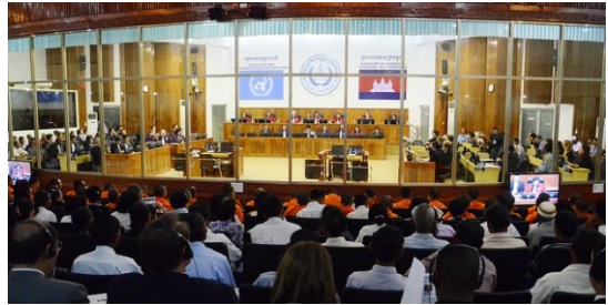
រូបថតនៃកិច្ចប្រជុំរបស់គណៈកម្មការអន្តររដ្ឋាភិបាលសិទ្ធិមនុស្សអាស៊ាន ធ្វើការពិភាក្សាគ្នាលើកិច្ចការបង្កើតសេចក្តីថ្លែងការណ៍សិទ្ធិមនុស្សអាស៊ាន។