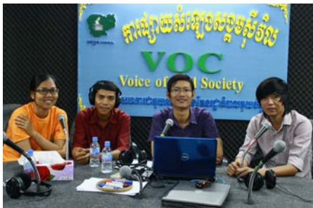
ការផ្សាយសម្លេងសង្គមស៊ីវិល ជាផ្នែកមួយនៃកម្មវិធីអប់រំអ្នកបោះឆ្នោតរបស់ ខុមហ្វ្រែល

ចក្ខុវិស័យ: សង្គមប្រជាធិបតេយ្យមួយដែលដំណើរការប្រជាធិបតេយ្យ ហូបនីយកម្ម ជាពិសេសរាល់ការបោះឆ្នោតតាមបែបប្រជាធិបតេយ្យត្រូវ បានលើកតម្កើង និងមានគុណភាពនាំមកនូវផលប្រយោជន៍ជូនដល់ ប្រជាពលរដ្ឋ។