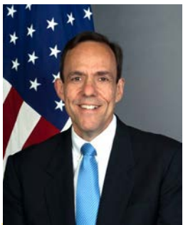
លោក វីលលៀម ថត (William Todd) ស្ថានទូតសហរដ្ឋអាមេរិកប្រចាំកម្ពុជា

ការរីកចម្រើនវិស័យផ្សេងៗទៀត របស់កម្ពុជា ឲ្យចាក់ផ្សាយតាម ទូរទស្សន៍នៅខេត្តក្វាងស៊ី ប្រទេស ចិន ដែរ។ ខេត្តក្វាងស៊ី នោះ មាន