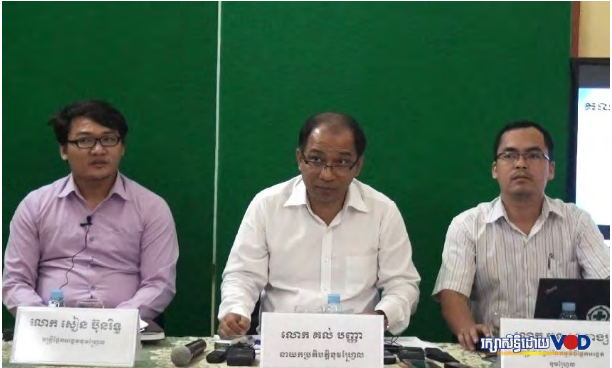
ស្តីស្រីនប្បដ្ឋាភិបាលនយោបាយសេដ្ឋកិច្ចសង្គម និងការផ្តល់សេវាសាធារណៈដល់ពលរដ្ឋនៃការអនុវត្តគោលនយោបាយរបស់រដ្ឋាភិបាល

ដោយ កញ្ញា ខាន់ លក្ខិណា | ថ្ងៃពុធ ទី២៤ ខែកុម្ភៈ ឆ្នាំ២០១៦