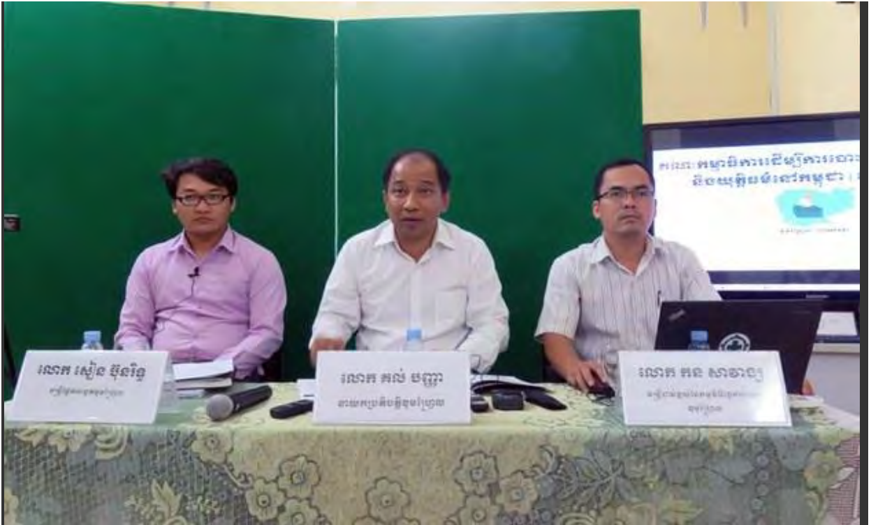
គណៈកម្មាធិការដើម្បីការបោះឆ្នោតដោយសេរី និងយុត្តិធម៌នៅកម្ពុជា ហៅកាត់ថា ខុមហ្វ្រែល (COMFREL) ធ្វើសន្និសីទបង្ហាញរបាយការណ៍វាយតម្លៃលើការអនុវត្តរបស់រដ្ឋាភិបាលនៃរដ្ឋសភានីតិកាលទី៥ កាលពីថ្ងៃទី២៣ កុម្ភៈ ឆ្នាំ២០១៦។

http://www.rfa.org/khmer/news/politics/comfrel-reports-on-govt-work-02232016215804.html