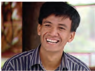
លោក ចំរើន ជាមនុស្សសកម្មក្នុងឃុំ