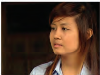
សុជាតិ ជាសកម្មជនឃុំ ខុមហ្វ្រែល