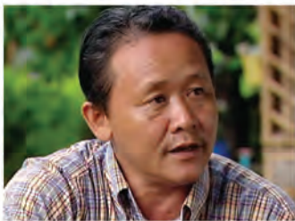
លោក ដាក់ ជាអ្នកចេះដឹងក្នុងឃុំ