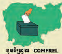
ខុមហ្វ្រែល COMFREL