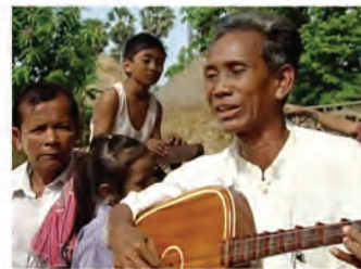
លោកតាដេញចាប៊ី ជាព្រឹទ្ធាចារ្យយល់ដឹងច្រើន