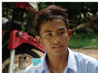
ពន្លក ជានិស្សិត