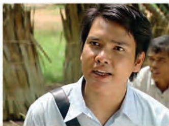
ឧត្តម ជានិស្សិត