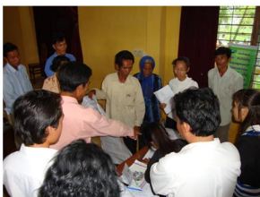
ការអភិវឌ្ឍ វិស័យឯកជន និងការងារ