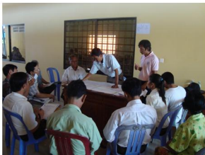
ការបង្កើនស្តារ និង កសាងហេដ្ឋារចនាសម្ព័ន្ធរូបវន្ត