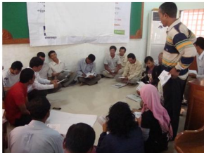
ការលើកស្ទួយ វិស័យកសិកម្ម