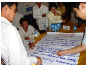
ការកសាង សមត្ថភាព និង ការអភិវឌ្ឍ ធនធានមនុស្ស