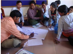
អភិបាលកិច្ចល្អ