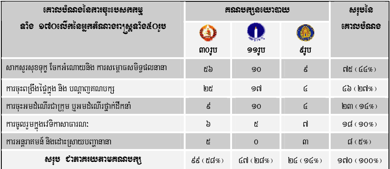
តារាងទី១៖ ចំនួនបេសកកម្មរបស់អ្នកតំណាងរាស្ត្រតាមគោលបំណងផ្សេងៗដែលខុមហ្វ្រែលទទួលបាន