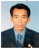
ឈ. កែវ វ៉េមី

ក្នុងសម័យប្រជុំវិសាមញ្ញក្នុងខែនេះ មានការផ្លាស់ប្តូរសមាជិកភាពចំនួនពីររូបមកពីគណបក្ស ប្រជាជនកម្ពុជា និងគណបក្ស សមរង្ស៊ី ។