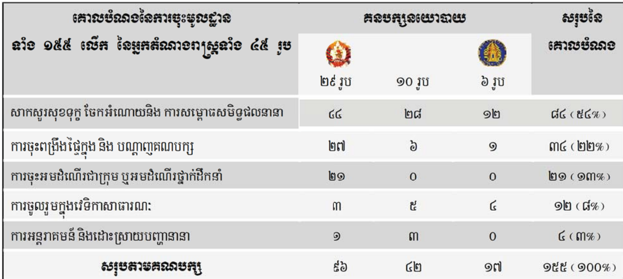
តារាងទី១៖ ចំនួនលើកនៃការចុះមូលដ្ឋានរបស់អ្នកតំណាងរាស្ត្រតាមគោលបំណងផ្សេងៗដែលខុមហ្វ្រែលទទួលបាន

ចំណែកតំណាងរាស្ត្រ គណបក្ស សមរង្ស៊ី យ៉ាងតិចចំនួន ១០ រូប (ស្មើនឹង ៤២% នៃអ្នកតំណាងរាស្ត្រគណបក្សនេះទាំងអស់ដែលមានចំនួន ២៤ រូប) បានចុះមូលដ្ឋានយ៉ាងតិចចំនួន ៤២ លើក (ឬជាមធ្យមអ្នកតំណាងរាស្ត្រគណបក្សនេះ ១ រូប ចុះមូលដ្ឋានបានចំនួន ៤ លើក) ហើយអ្នកតំណាងរាស្ត្រគណបក្ស ហ៊ុនស៊ីនប៊ុច យ៉ាងតិចចំនួន ៦ រូប (ស្មើនឹង ២៣% នៃ អ្នកតំណាងរាស្ត្រគណបក្សនេះទាំងអស់ដែលមានចំនួន ២៦ រូប) បានចុះមូលដ្ឋានយ៉ាងតិចចំនួន ១៧លើក (ឬជាមធ្យមអ្នកតំណាងរាស្ត្រគណបក្សនេះ ១ រូប ចុះមូលដ្ឋានបាន ៣ លើក) ។